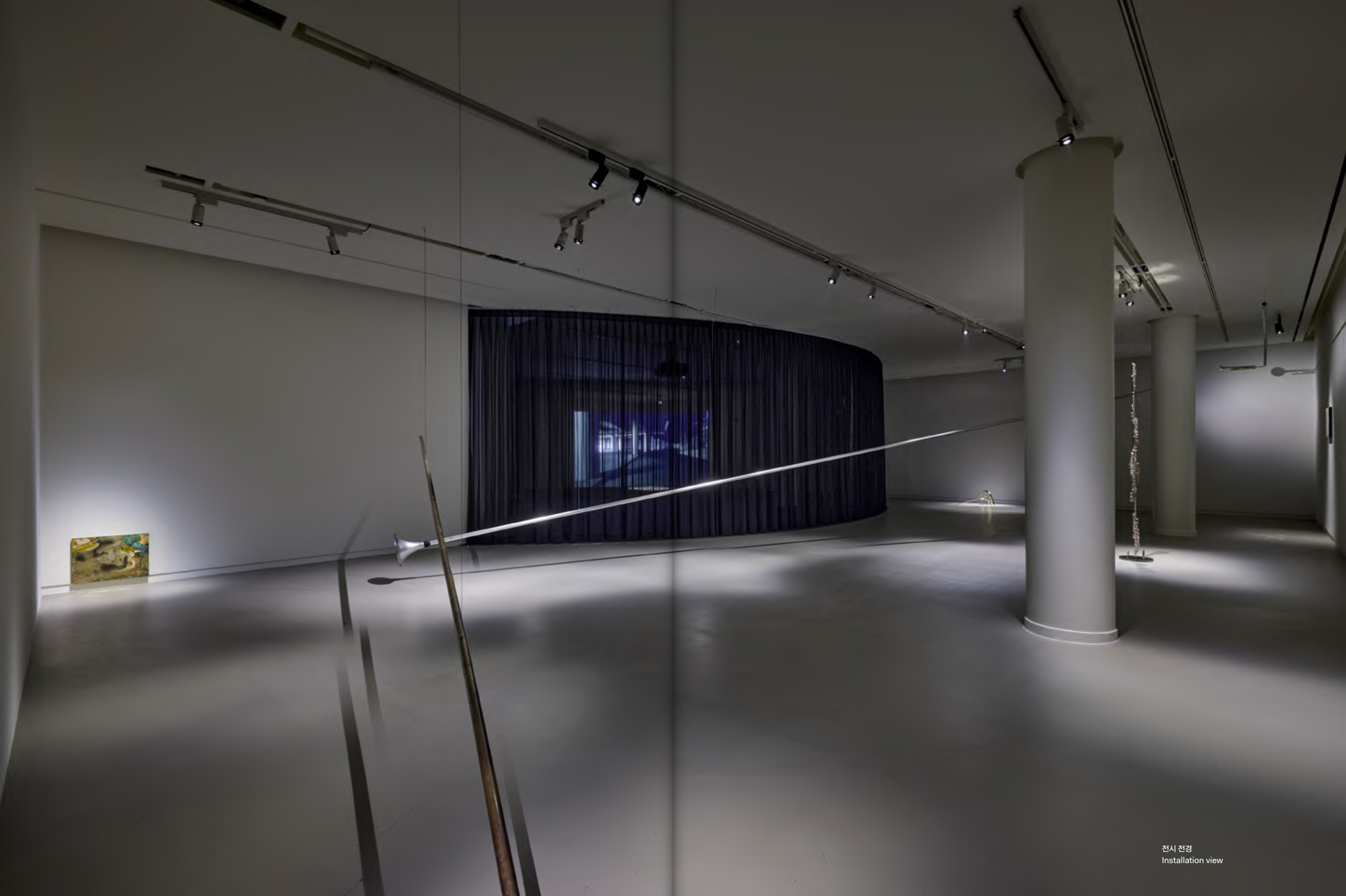
전시 전경 Installation view