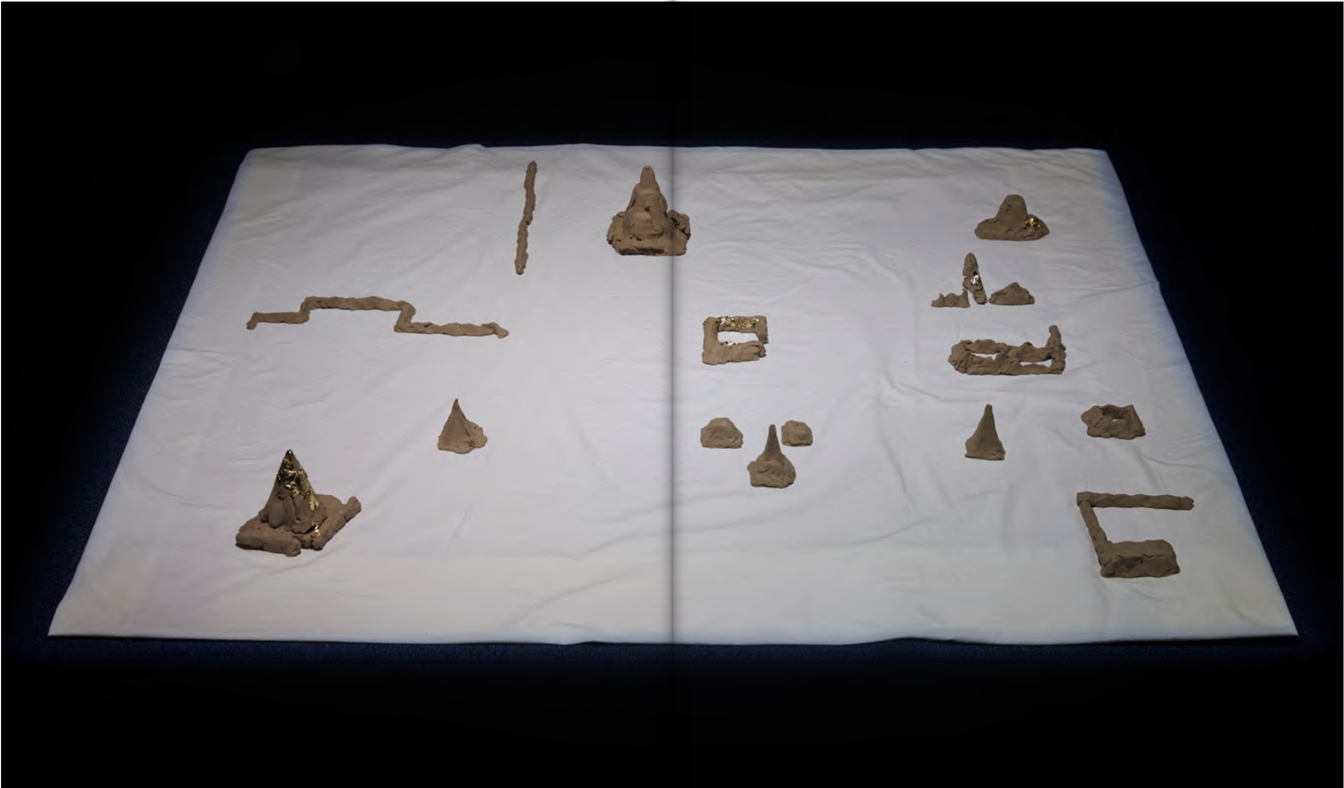
새로운 사원 유토, 천, 금박지, 가변크기 A New Temple Clay mixed with oil, cloth, gold foil, dimensions variable, 2022