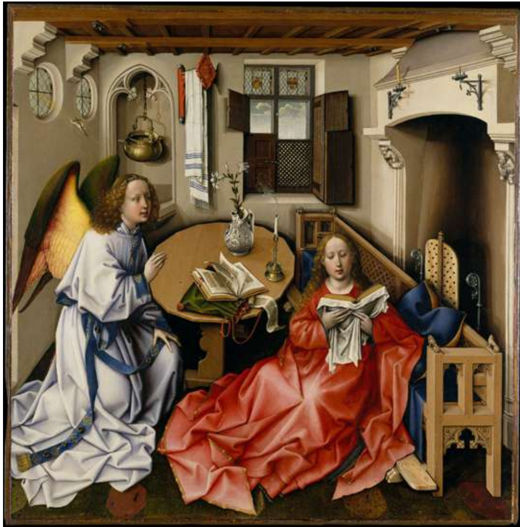
Merode Altarpiece, Robert Campin, c. 1427–1432, oil on oak, 64.5 x 117.9 cm, The Cloisters Collection, courtesy of The Metropolitan Museum of Art 메로드 제단화, 로베르 캉핀, c. 1427–1432, 오크에 유화, 64.5x117.9 cm, 클로이스터 컬렉션, 메트로폴리탄 미술관 제공