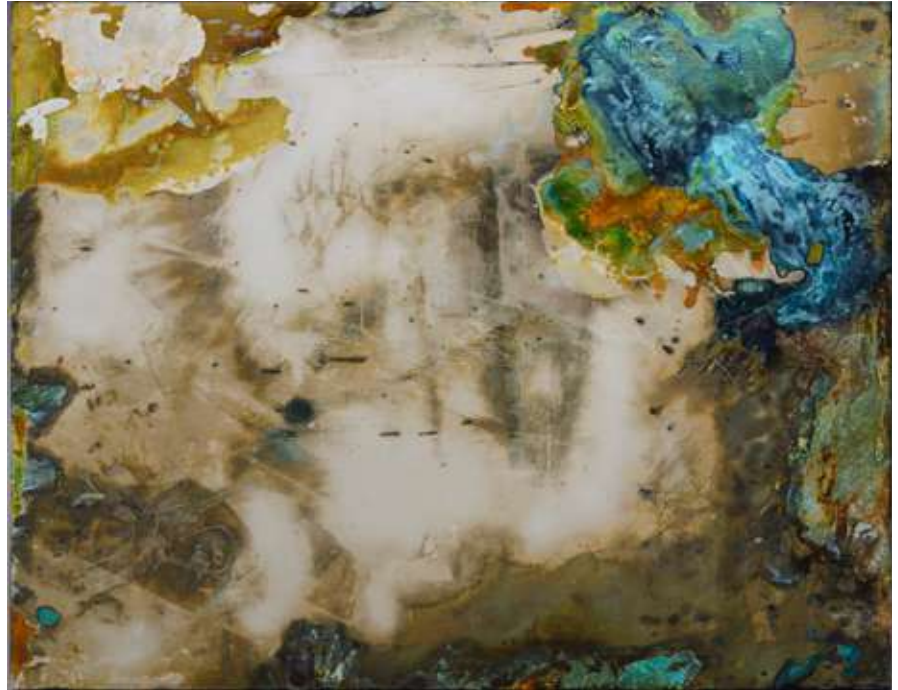
창문-꿈 백동판에 부식액 Window-Dream Corrosion solutions on nickel, 39 x 50cm, 2022