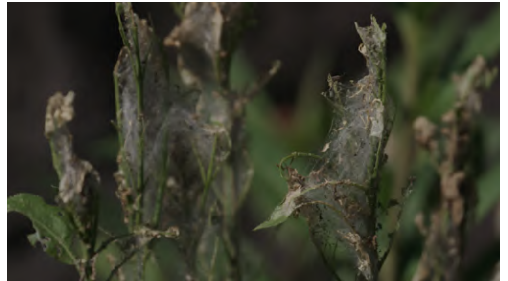
가브리엘(스틸 이미지) 단채널 비디오, 6채널 사운드, 20분 4초 Gabriel (still image) single channel video, 6 channel sound, 20min 4sec, 2022