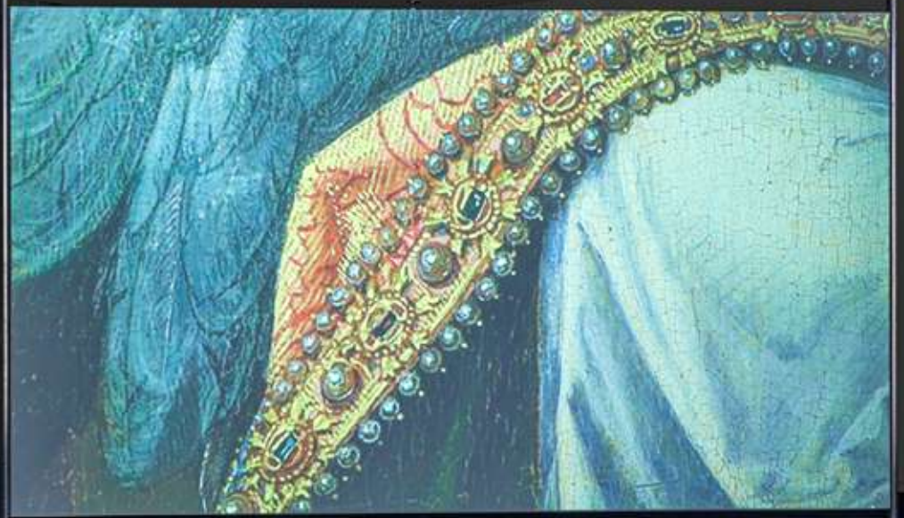
가브리엘 단채널 비디오, 6채널 사운드, 20분 4초, 반복 재생 Gabriel single channel video, 6 channel sound, 20min 4sec, loop, 2022