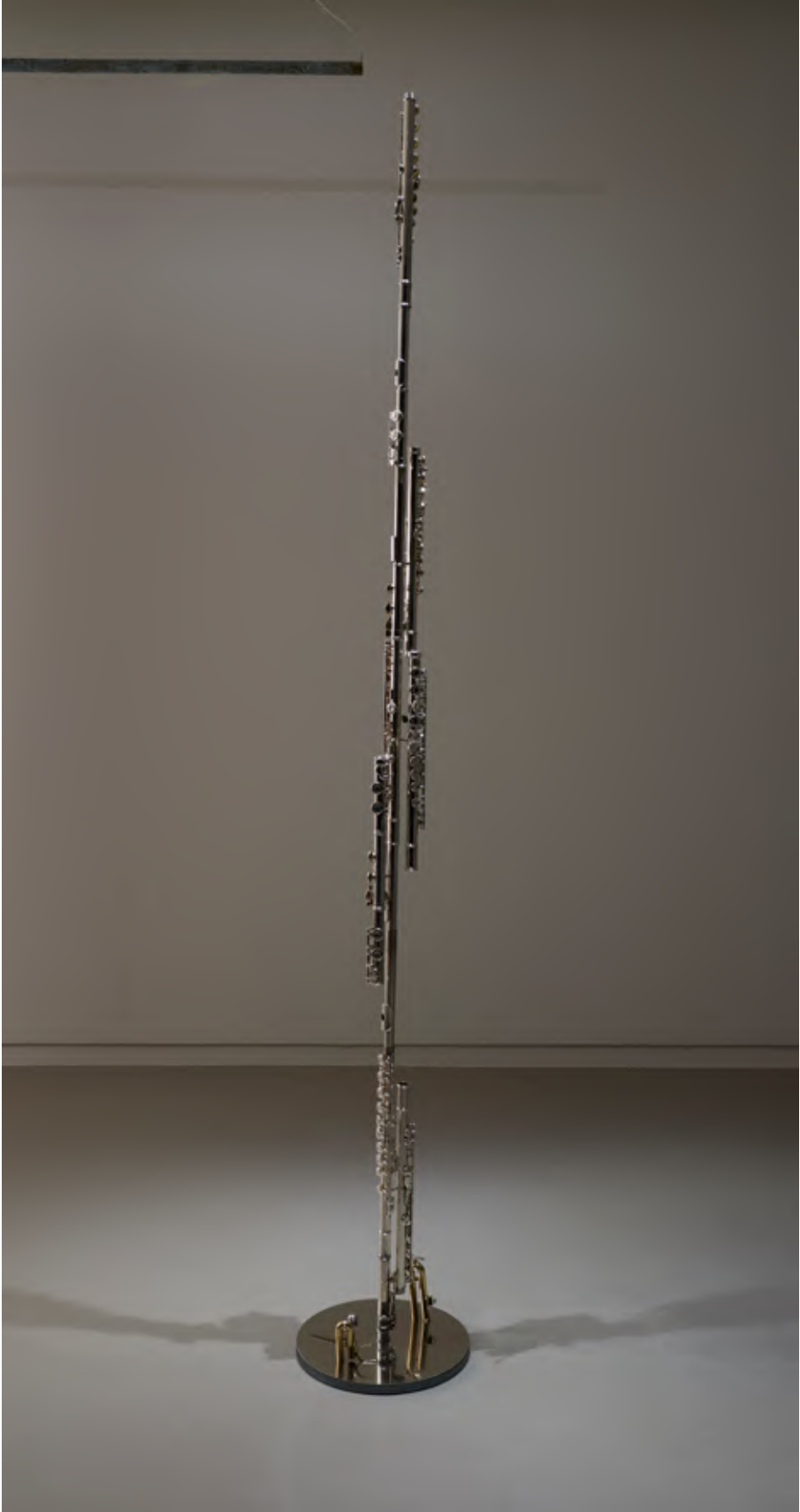
코다(부분) Coda (detail)