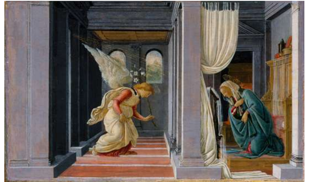
The Annunciation, Botticelli, c. 1485–1492, tempera and gold on wood, 19.1 x 31.4 cm, Robert Lehman Collection 수태고지, 보티첼리, c.1485–1492, 나무에 템페라와 금박, 19.1x31.4 cm, 로버트 레만 컬렉션