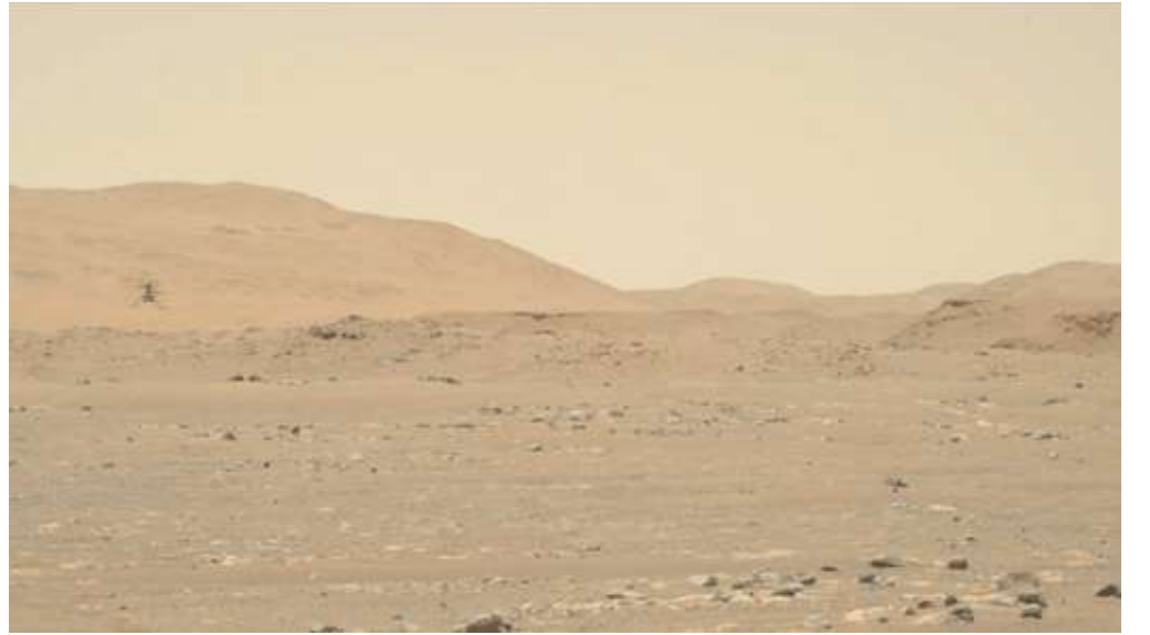
가브리엘(스틸 이미지) 단채널 비디오, 6채널 사운드, 20분 4초 Gabriel (still image) single channel video, 6 channel sound, 20min 4sec, 2022